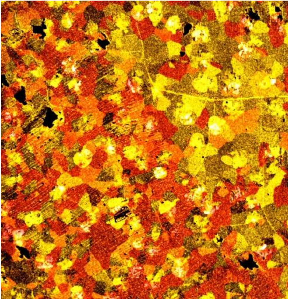
显微镜下的一块石墨烯，伪色标记。每一“色块”代表一片石墨烯“单晶”。