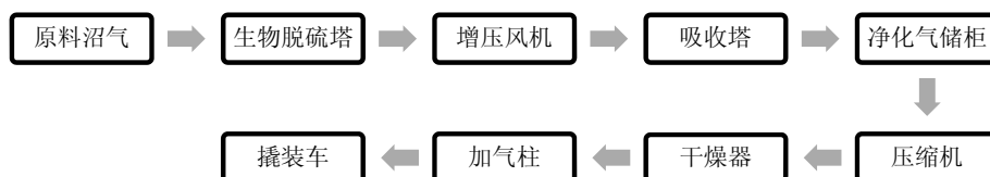
图 1 公司生物天然气提纯工艺流程图

安阳贞元集团恒生能源建设的生物燃气公司是中国第一家上市生物燃气公司，由贞元集团与丹麦合资兴建，工程占地 60 亩，投资 5500 万元，建成后生物天然气产量达 300-400 万 m 3 /年。以下是公司生物天然气生产工艺流程和主要生产指标。